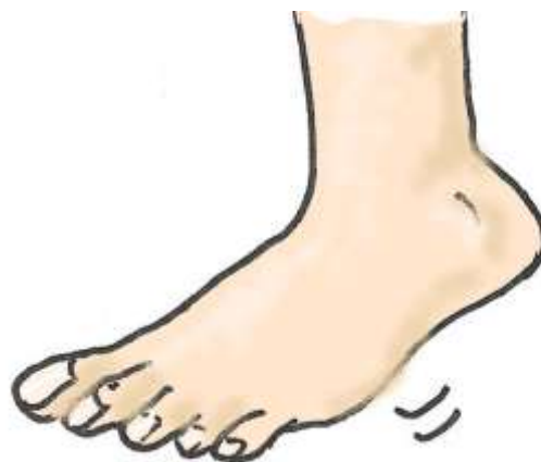
Stamp med fod