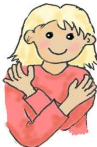
Slå på skuldre