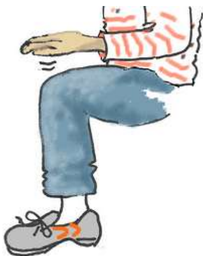
Klap på knæ